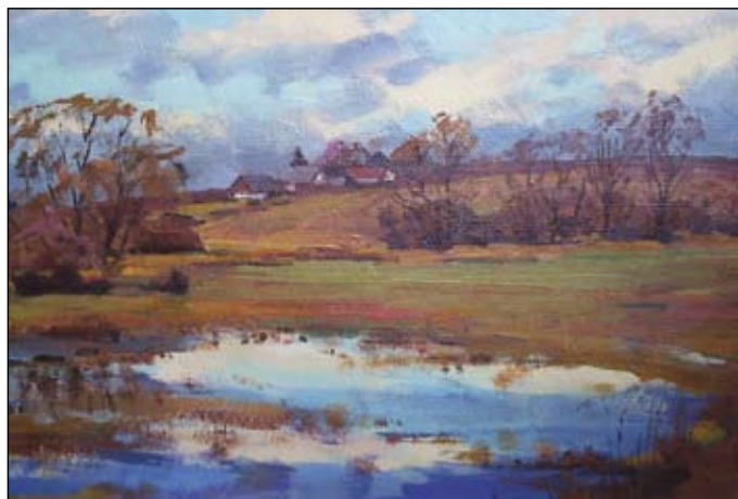
Předjaří na Milovech